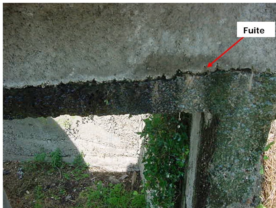
Photo 1 : fuite relevée sur le canal d'entrée de la station du village :

En revanche, le rapport SATESE de mars 2004, ne fait aucune remarque sur le génie civil, les fuites ayant été colmatées.